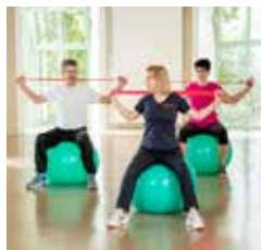
FIT IM ALLTAG