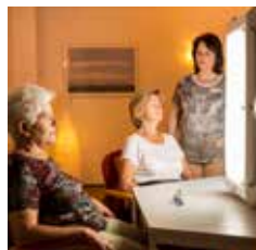
WINTERSONNE (1) (LICHTTHERAPIE)