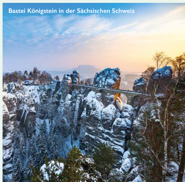
Bastei Königstein in der Sächsischen Schweiz

100 € Rabatt p.P. gilt für Neu-Buchungen ab dem 16.08.24 gültig für alle Kategorien (nach Verfügbarkeit)