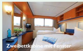
Zweibettkabine mit Fenster