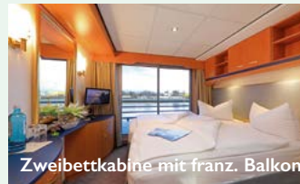
Zweibettkabine mit franz. Balkon

Ihre Zahlungen sind gemäß der gesetzlichen Bestimmungen über DRSF, Deutscher Reiseversicherungsfonds GmbH, Sächsische Straße 1, 10707 Berlin, versichert.