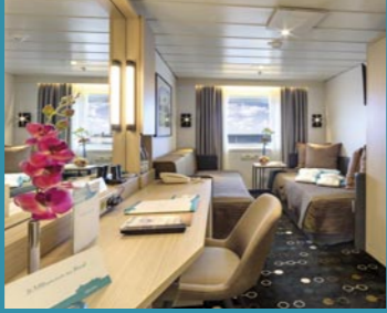
2-Bett außen, Neptun-/Saturn-/Orion-/Apollo-Deck (Kat. I, J, K, M, O, J1, L)