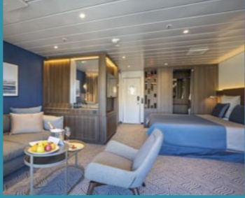
2-Bett-Suite, Balkon, Lido-Deck (Kat. V)