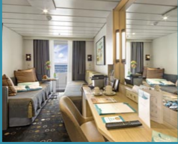
2-Bett-Superior, Balkon, Orion-/Apollo-/Jupiter-Deck (Kat. PG, P, Q, R, Q1)