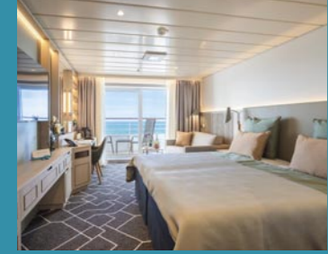
2-Bett-Junior-Suite, Balkon, Jupiter-/Lido-Deck (Kat. S, T)