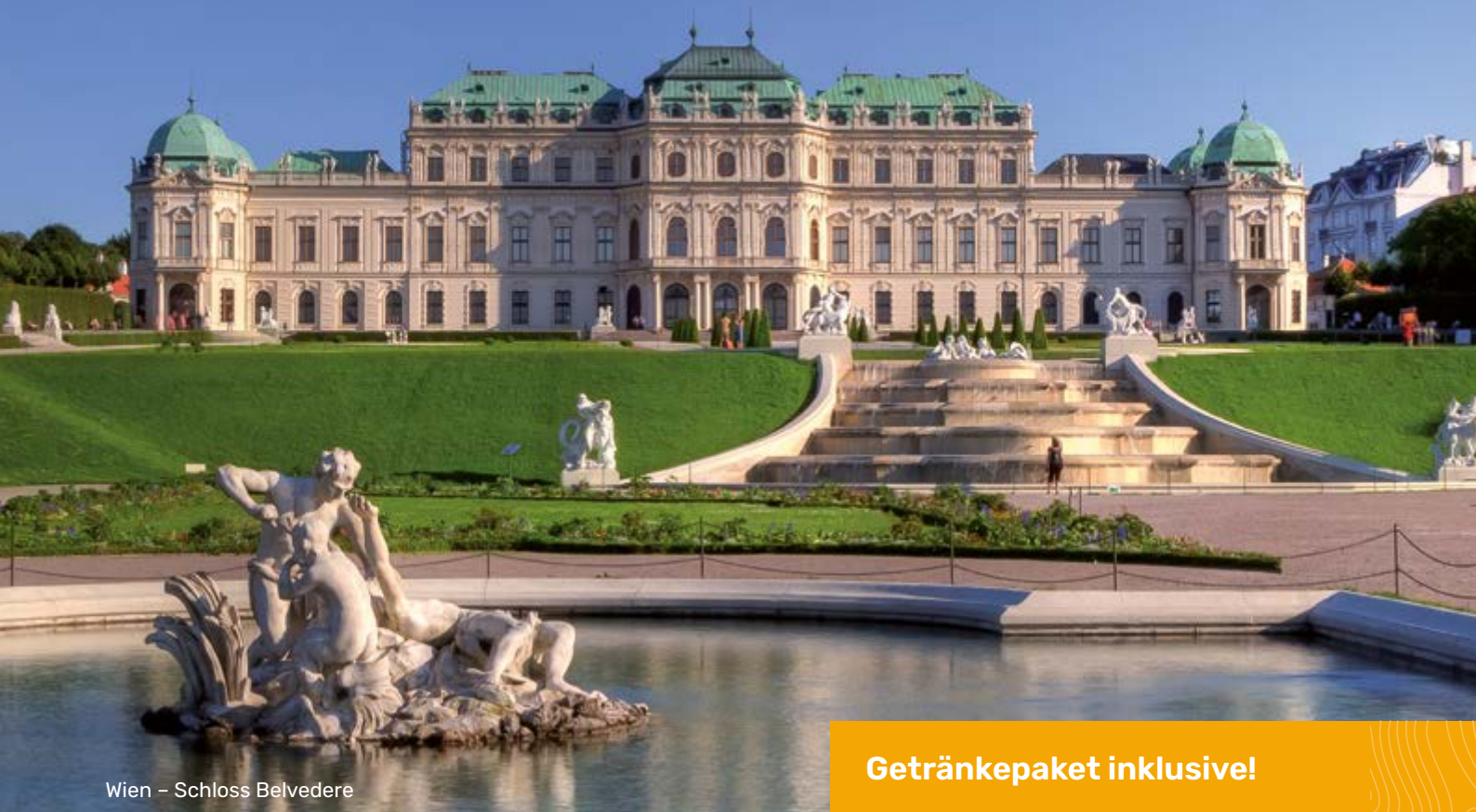
Wien – Schloss Belvedere