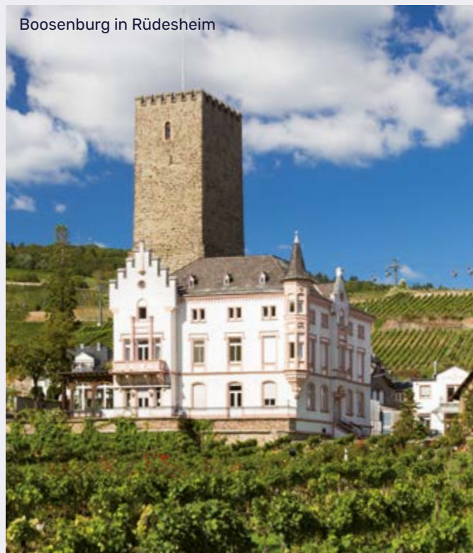
Boosenburg in Rudesheim