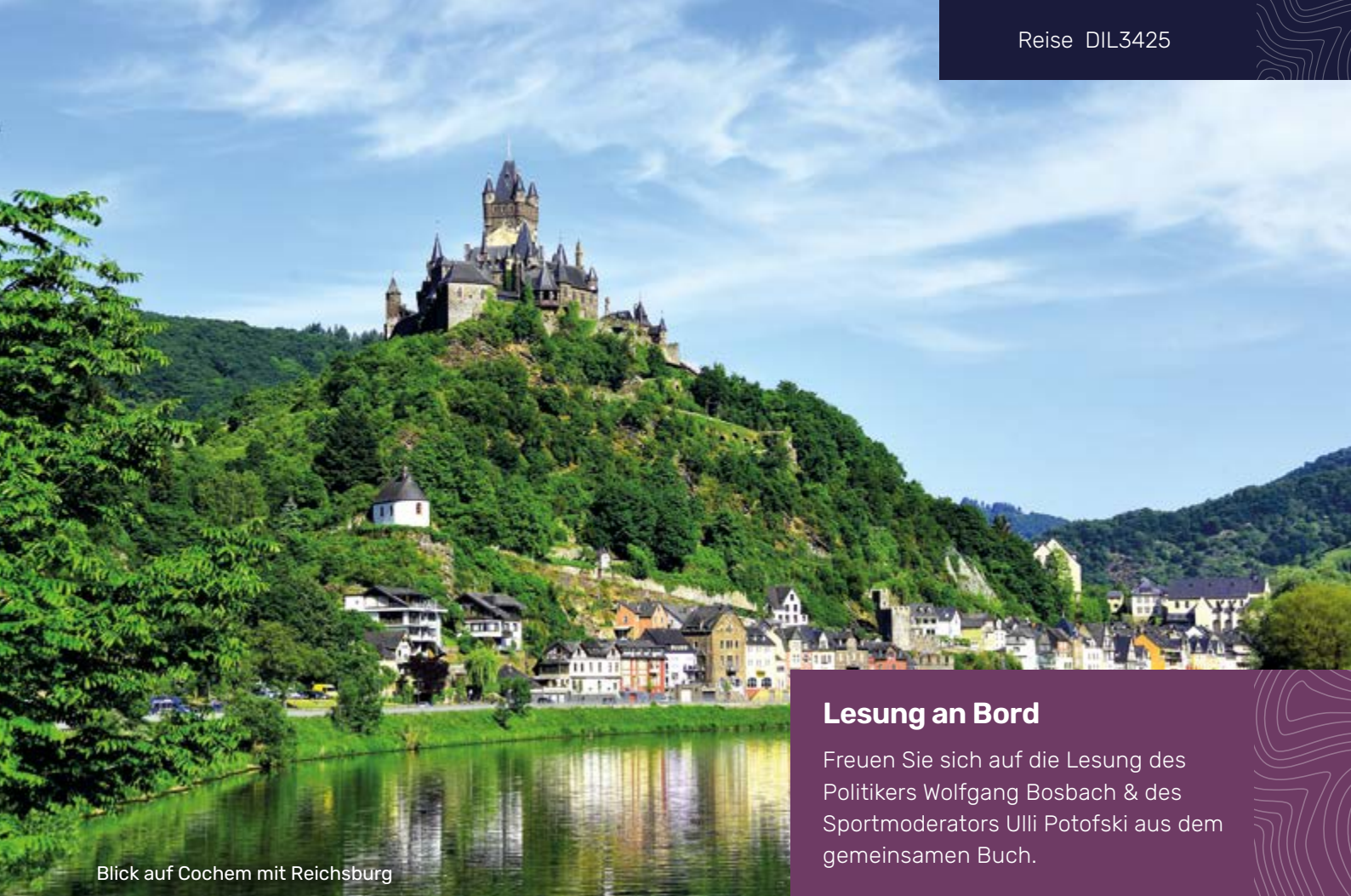
Blick auf Cochem mit Reichsburg