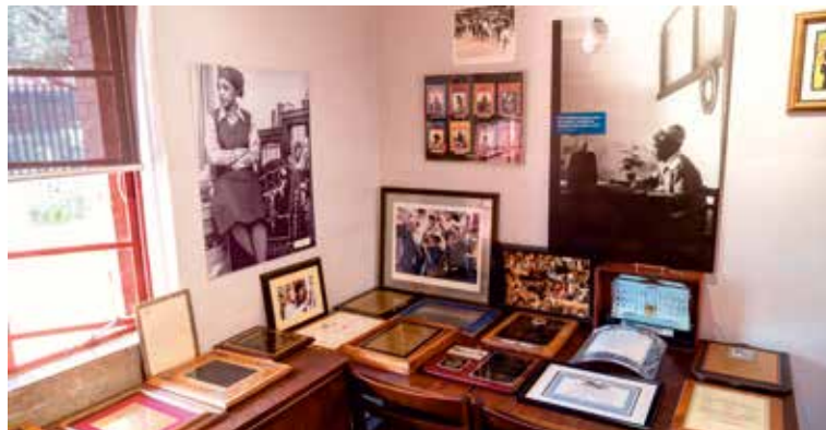
In Soweto besuchen wir das Museum Mandela House