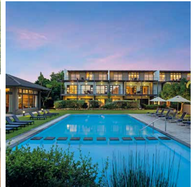
Erholsame Momente verspricht der Garten mit Pool