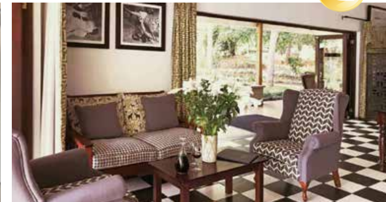
Das Hotel bietet Ruhe und Entspannung in idyllischer Natur