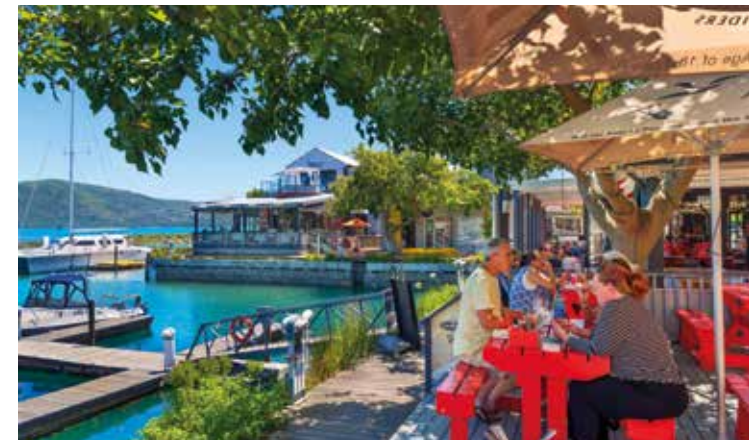
Die Waterfront Knysna Quays ist ein lebendiges Einkaufs- und Unterhaltungsquartier