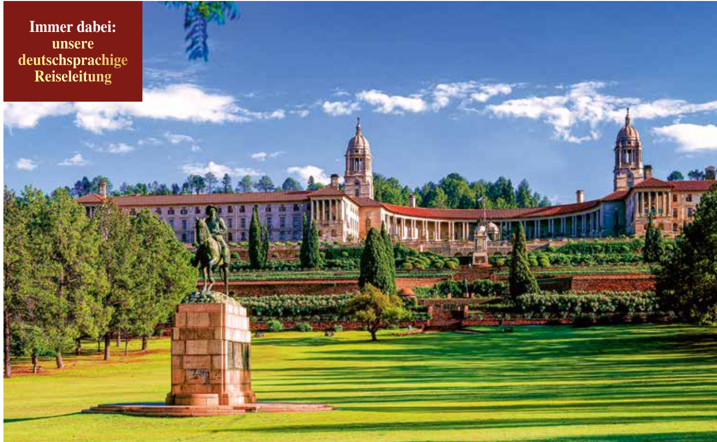
Union Buildings und die prachtvoll angelegten Gärten mit zahlreichen Statuen

Immer dabei: unsere deutschsprachige Reiseleitung