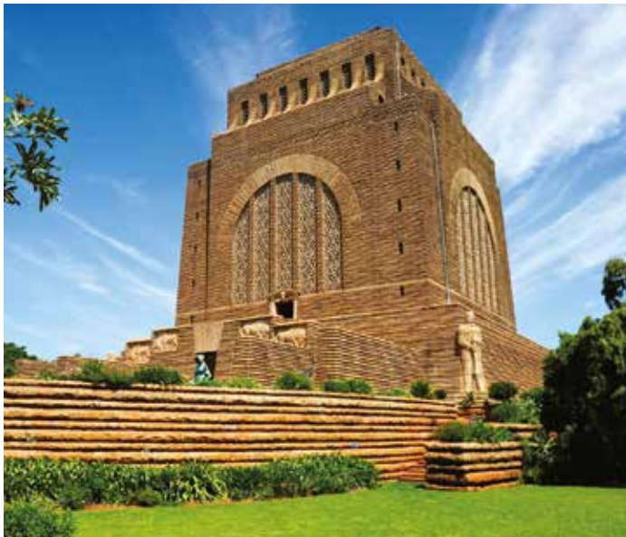
Eines der größten Granitbauwerke der Welt

Das in ein nationales Naturreservat eingebettete Voortrekkerdenkmal ist ein äußerst geschichtsträchtiges Monument für die einheimische Bevölkerung. Es erinnert an die Migration der Buren aus der Kapkolonie, ihr Heldentum und ihre Ausdauer. Das massive Denkmal ist mit Ochsenwagen und heroischen Figuren verziert.