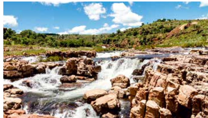
Auf einem Rundweg kann man die Bourke's Luck Potholes und kleine Wasserfälle besichtigen

Heute starten wir früh in unser nächstes Abenteuer.