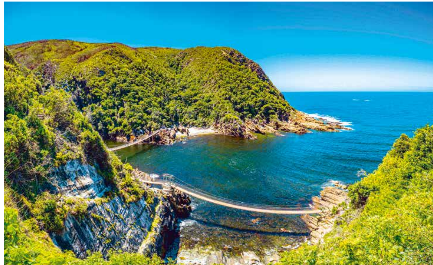
Die Suspension Bridge überspannt 77 Meter der Mündung des Storms Rivers