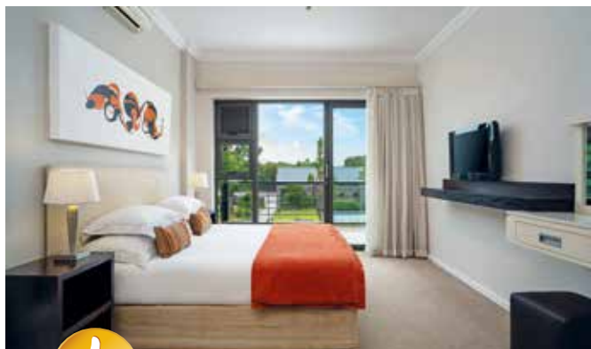
Das Premier-Hotel-&-Resort „The Moorings“ begrüßt uns am Ufer der Lagune von Knysna