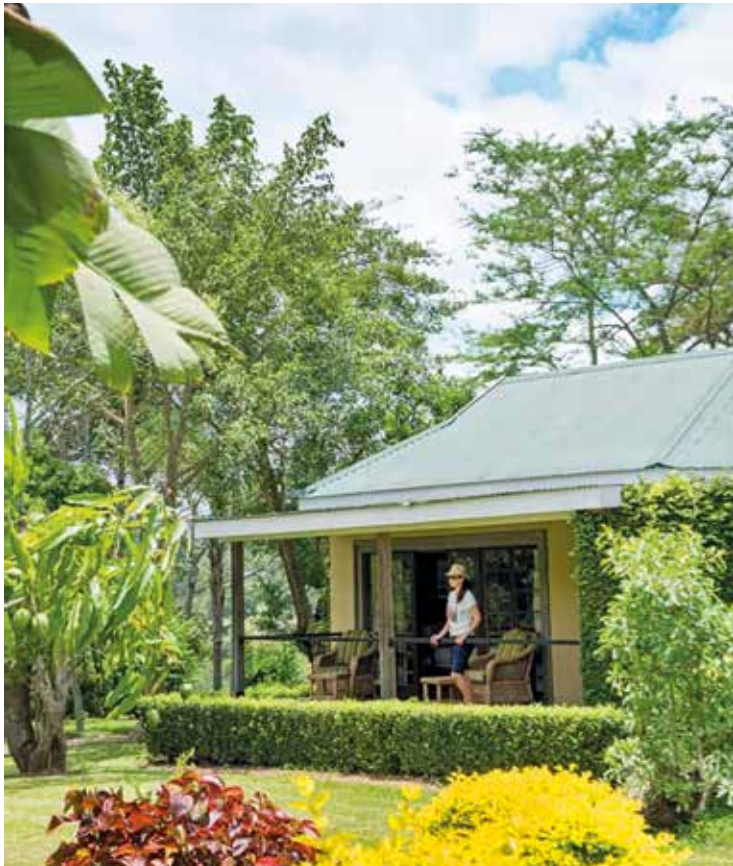
Chalets mit Terrasse und Gartenblick

Frühstücksbuffet o. Frühstückspaket, je nach Ausflugsstag