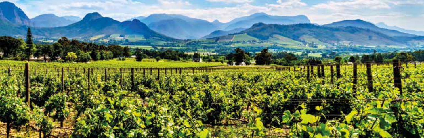
Wir genießen Spitzenweine und erfreuen uns an der historischen Kap-Architektur