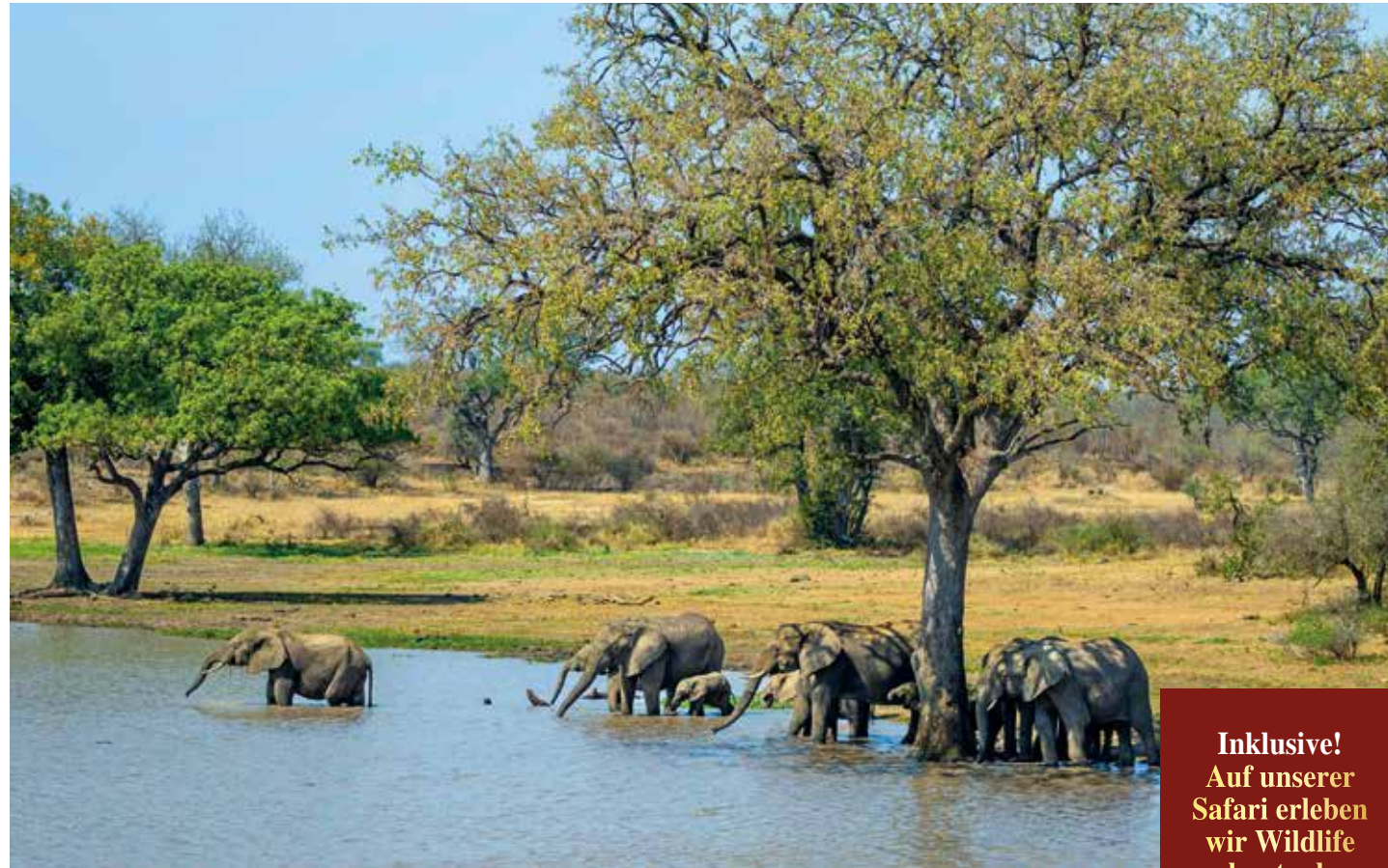
Elefanten halten sich gerne an Flussläufen auf

Inklusive! Auf unserer Safari erleben wir Wildlife hautnah