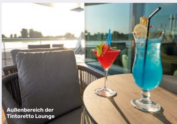
Außenbereich der Tintoretto Lounge