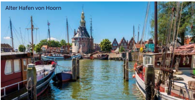
Alter Hafen von Hoorn

Alle Zeiten sind Richtzeiten. Programmänderungen, auch durch Hoch- oder Niedrigwasser, oder Verzögerungen bei Schleusendurchfahrten sind vorbehalten.