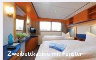
Zweibettkabine mit Fenster