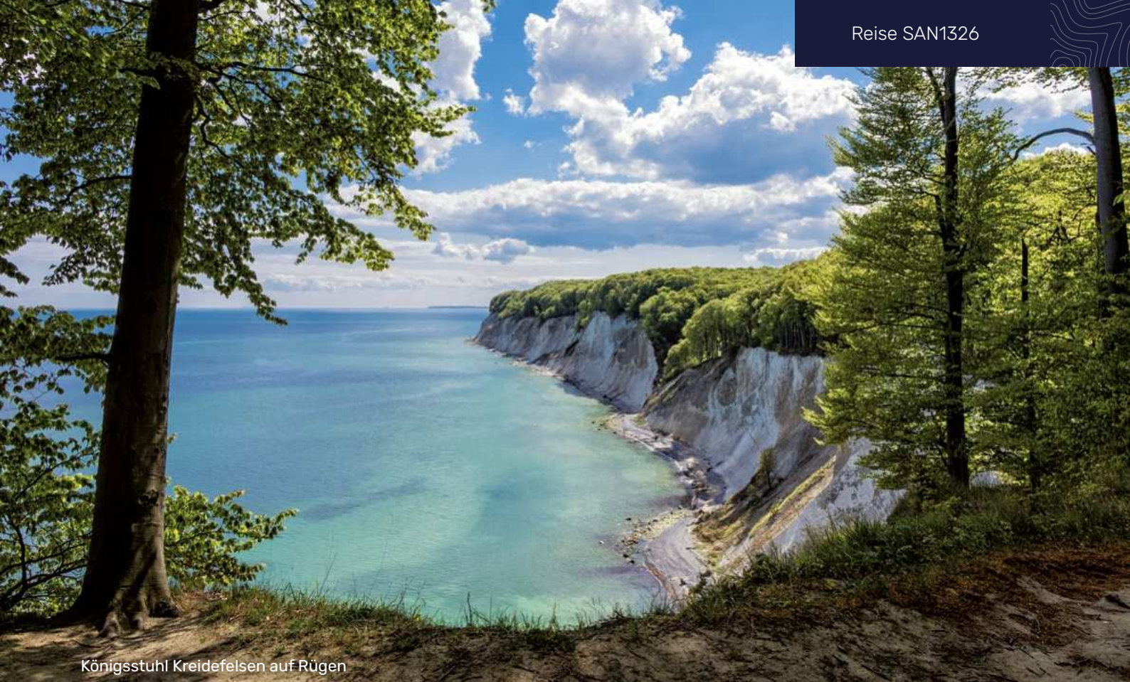
Königsstuhl Kreidefelsen auf Rügen