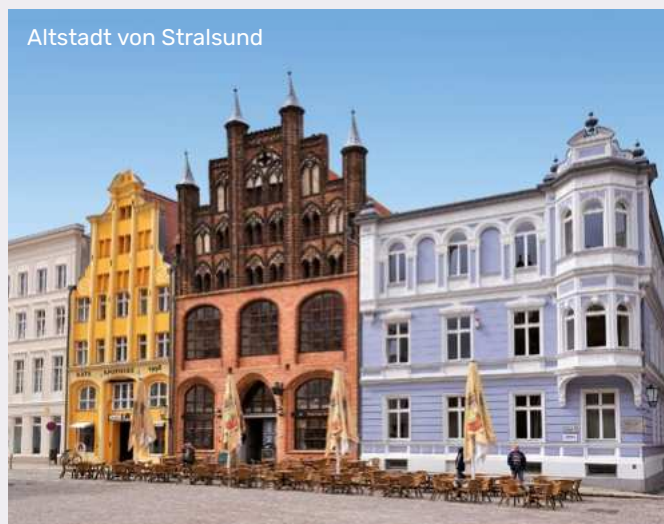
Altstadt von Stralsund