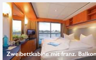
Zweibettkabine mit franz. Balkon

Ausführliche Informationen auf unserer Website und im Katalog.