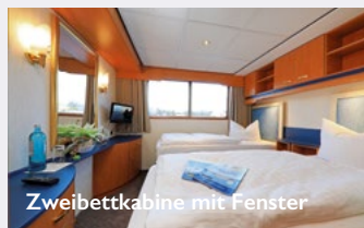
Zweibettkabine mit Fenster