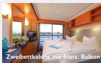
Zweibettkabine mit franz. Balkon

Reisebedingungen: Es gelten die AGB des Veranstalters.