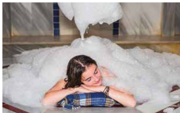
Entspannen wie im Morgenland (kostenpflichtig)