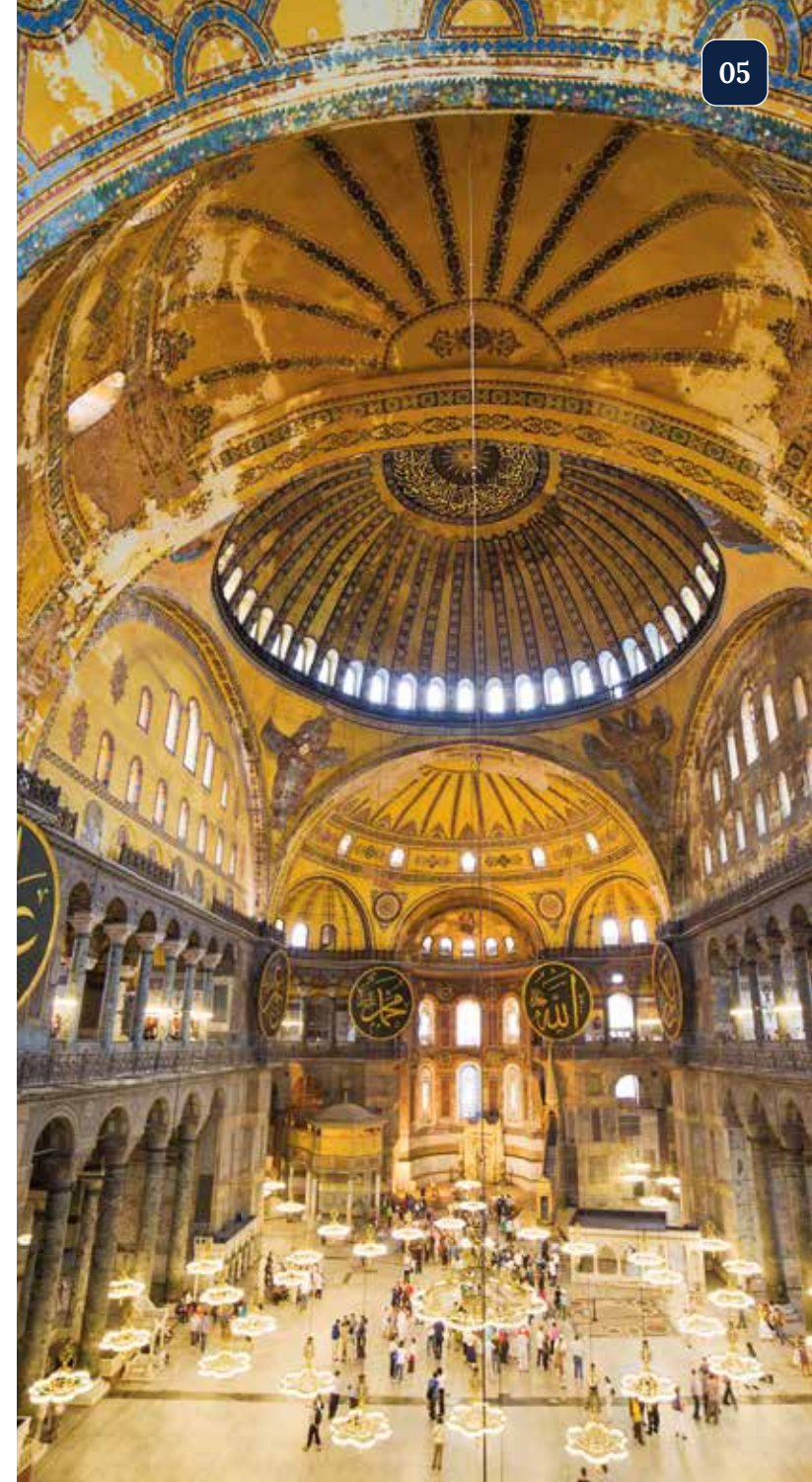
Imposanter Ausblick vom Emporengang der Hagia Sophia