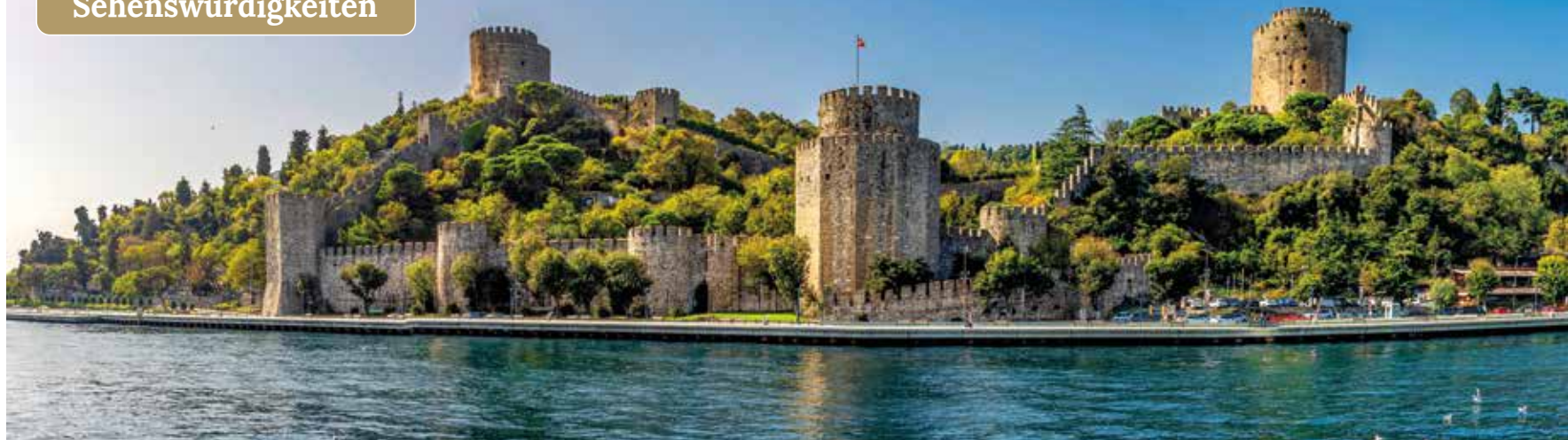
Wir erblicken die majestätische Festung Rumeli Hisari, die wie ein Wächter über dem Bosphorus thront

Große Schiffsrundfahrt entlang zahlreicher Sehenswürdigkeiten