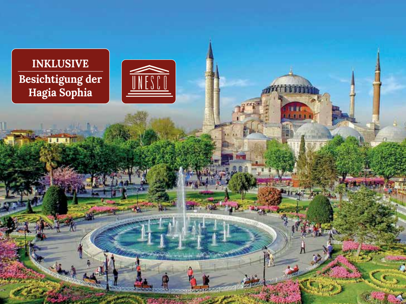
Die Hagia Sophia – ein atemberaubendes Meisterwerk umgeben von einer beeindruckenden Gartenanlage