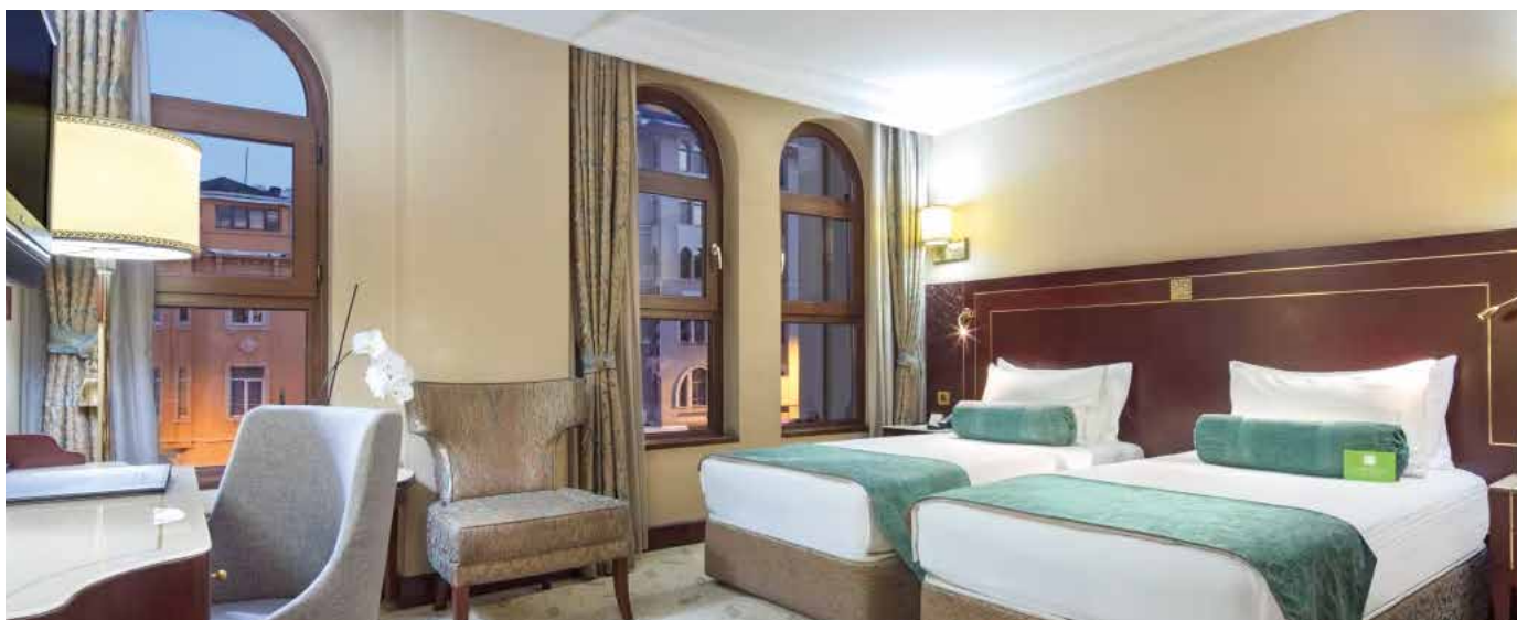
Wohlfühlen mit Klasse – Ihr Rückzugsort nach erlebnisreichen Tagen in Istanbul