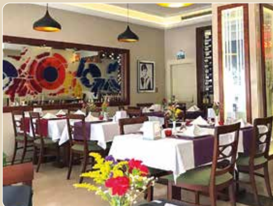
Klassisch elegantes Restaurant „Byzantion“