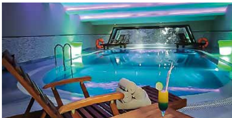
Gönnen Sie sich eine Auszeit am Pool