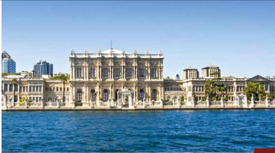
Majestätischer Dolmabahçe-Palast – ein Blick auf die osmanische Pracht