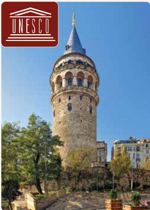
Galataturm, Wahrzeichen Istanbuls

Während unserer Schifffahrt genießen wir den spektakulären Blick auf die Silhouette Istanbuls, ein eindrucksvolles Zusammenspiel von Tradition und Fortschritt