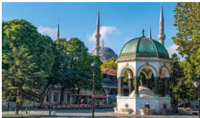
Der Deutsche Brunnen ähnelt einem Pavillon