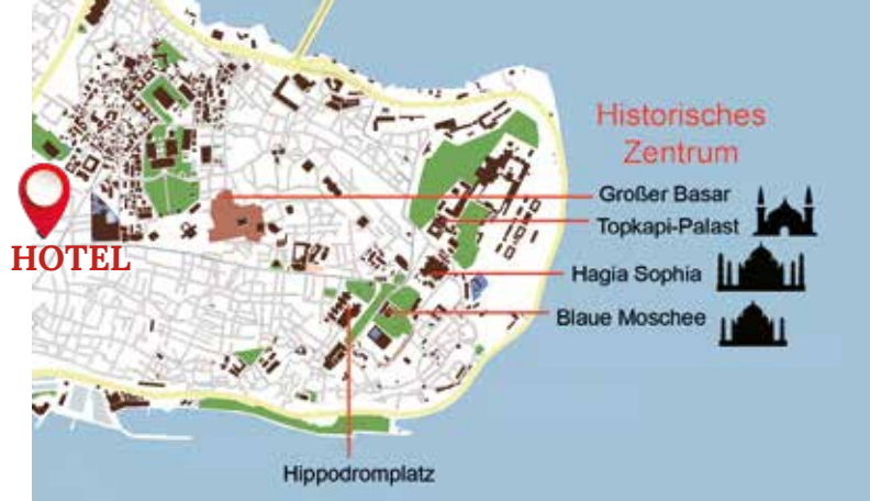
Das historische Viertel ist bequem zu Fuß erreichbar