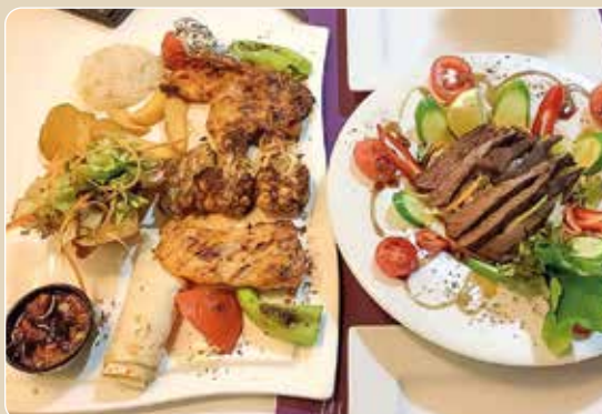
Kulinarisches Beispiel aus der Küche

Wir genießen ein exquisites 4-Gänge-Abendmenü im stilvollen Restaurant „Byzantion“. Die Gerichte zeichnen sich durch eine kreative Fusion der türkischen und mediterranen Küche aus, wobei frische, hochwertige Zutaten im Mittelpunkt stehen. Das elegante Ambiente des Restaurants und die herzliche Gastfreundschaft schaffen eine Wohlfühlatmosphäre, die unser kulinarisches Erlebnis bereichert. Es ist der perfekte Auftakt für unseren ersten Urlaubsabend in dieser faszinierenden Stadt.