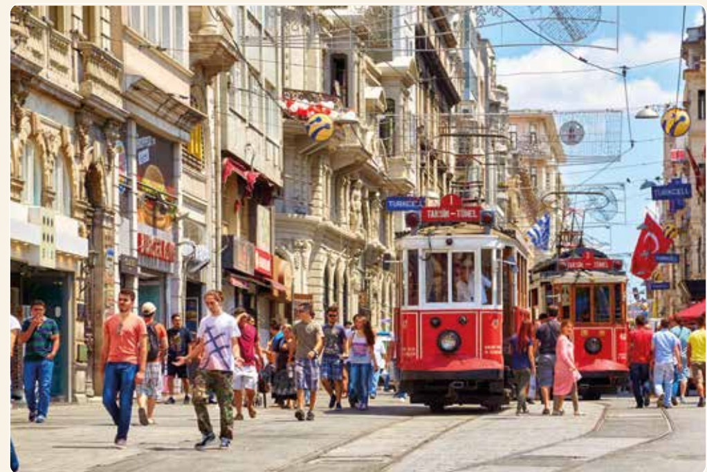
Die historische Tram auf dem Istiklal Boulevard ist ein beliebtes Fotomotiv

Eine moderne Standseilbahn bringt uns zum Taksim-Platz, wo wir in die lebendige Atmosphäre eintauchen. Von dort schlendern wir über den belebten Istiklal Boulevard, der von Cafés und Boutiquen gesäumt ist, und bewundern die architektonischen Stile, die von spätosmanischen bis hin zu modernen Bauten reichen, bis wir den Galataturm erreichen. Anschließend fahren wir mit einem nostalgischen Zug auf einer der ältesten Metrolinien der Welt zurück.