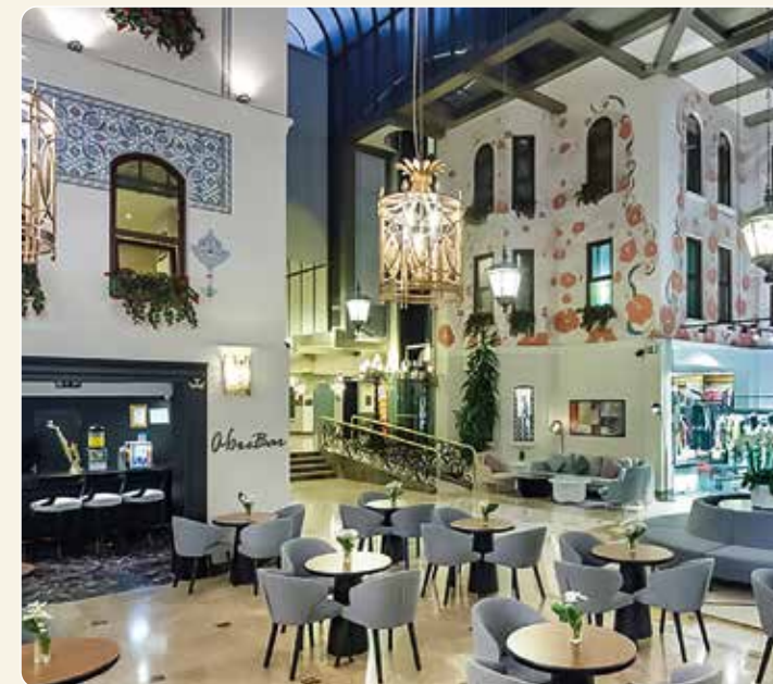
Elegantes Hotel-Atrium mit Shops, Bar und Café