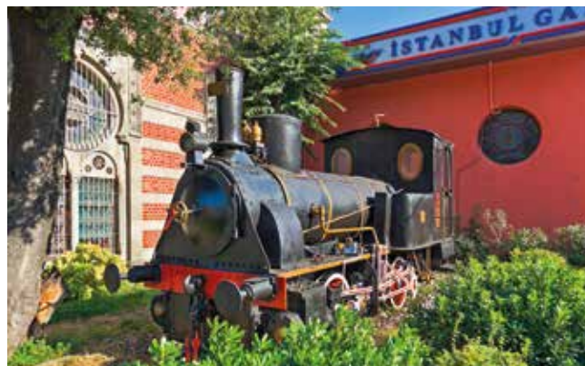
Ehemalige Lokomotive des Orient-Expresses