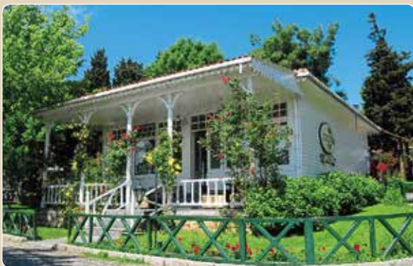
Restaurant im osmanischen Stil