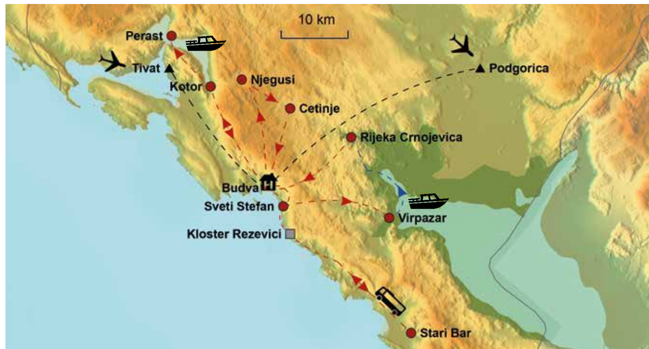
Unsere Reiseroute und Ausflugsziele im Überblick