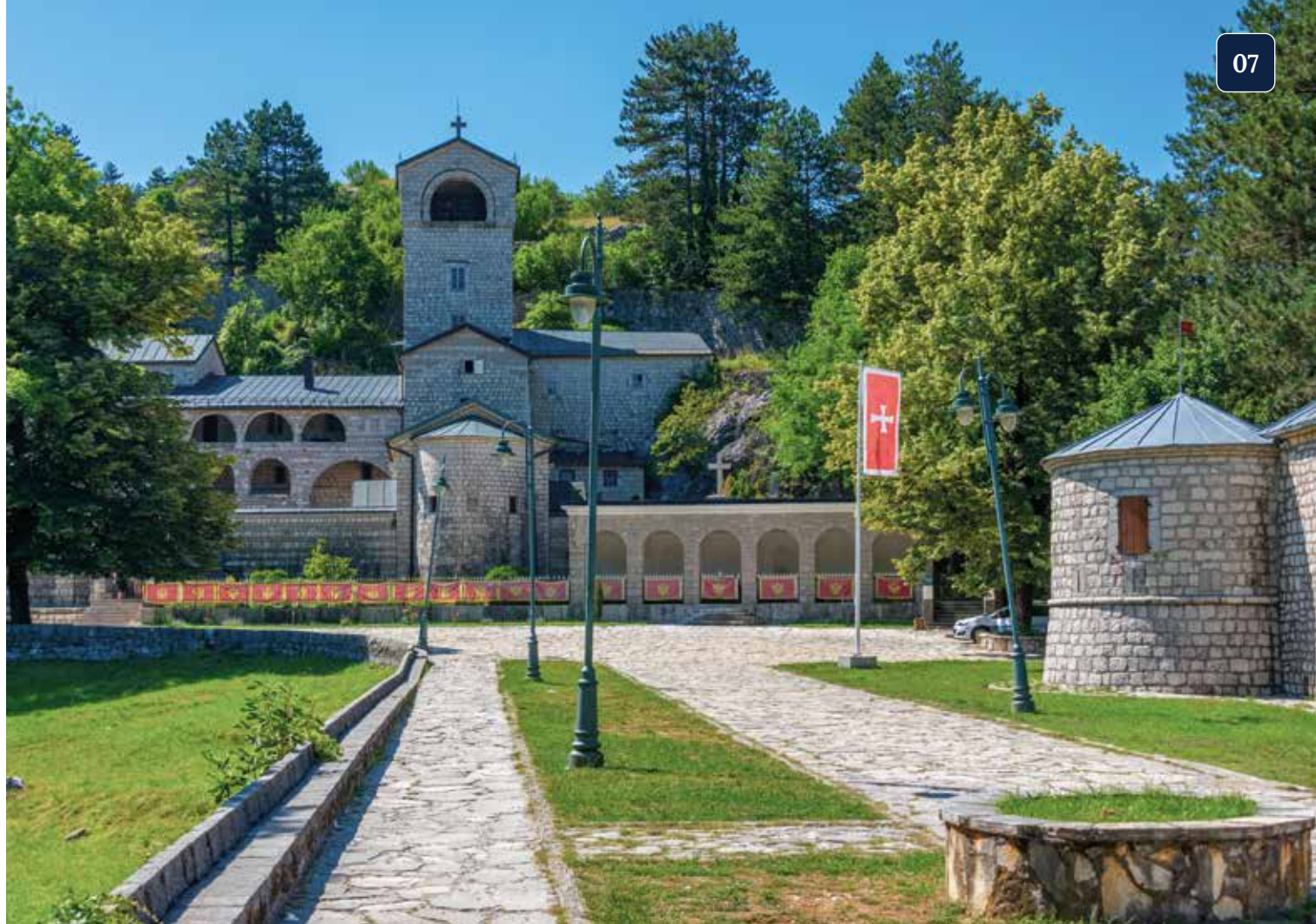
Traditionsreiches Klosterensemble in der alten Königsresidenz Cetinje

Das Dorf Njeguši ist für seine traditionellen Bergspezialitäten bekannt, die seit Generationen in handwerklicher Weise hergestellt werden. Hier erwartet uns eine kleine Verkostung von Käse und Schinken. Dazu werden ein Glas Wein und Tafelwasser gereicht.