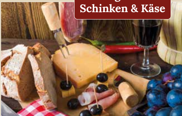
Kulinarische Kostprobe aus dem Bergland, Beispiel