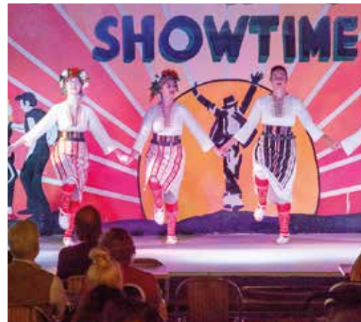
Inkludiertes Hotelangebot – von wohltuender Sauna bis zum Abendprogramm