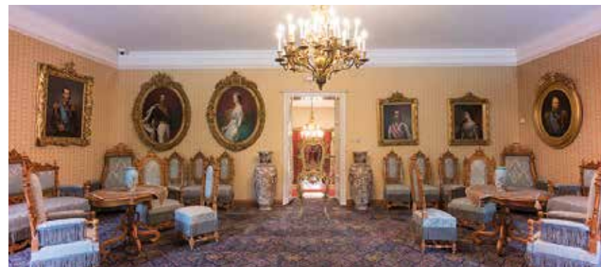
König-Nikola-Museum mit originalen Einrichtungsstücken

Weiter geht es über eine Serpentinstraße, begleitet von eindrucksvollen Ausblicken auf die Höhenzüge des Lovćen-Gebirges nach Cetinje. Die frühere Hauptstadt Montenegros bewahrt bis heute den Glanz einer Königsepoche. Bei einem Rundgang sehen wir Residenzen aus dem 19. Jahrhundert und das Königsmuseum im ehemaligen Palast Nikola I., dessen prunkvolle Salons, Möbel und Porträts einen anschaulichen Einblick in das einst höfische Leben vermitteln.