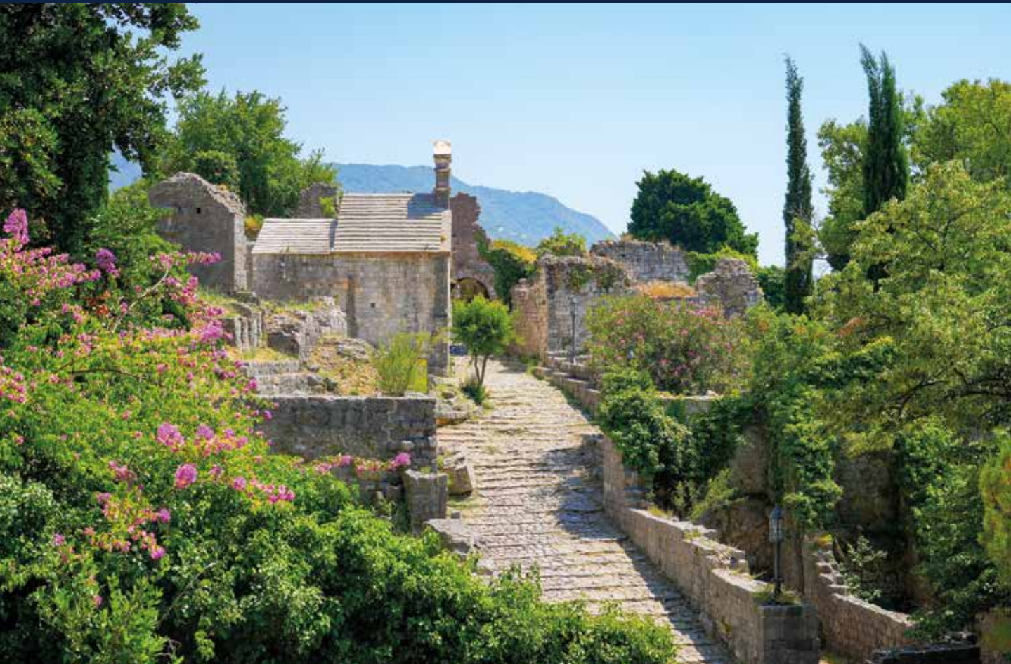
Wir spazieren durch die Festungsrüinen von Stari Bar – umgeben von mediterraner Natur