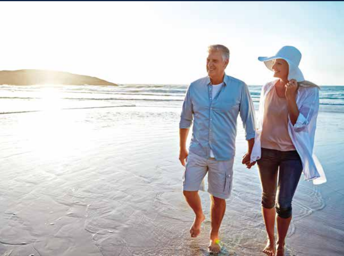
Genießen Sie einen entspannten Strandspaziergang