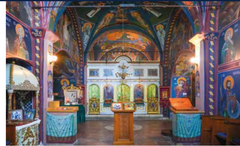
Farbenprächtiger Innenraum des Klosters Reževići

Ein Fotostopp führt uns zum Alten Olivenbaum von Bar – einem der ältesten Naturdenkmäler des Landes. In Stari Bar erkunden wir die weitläufigen Ruinen der ehemaligen Handels- und Festungsstadt, die inmitten einer markanten, mediterranen Berglandschaft liegen und einen deutlichen Kontrast zu den Küstenorten der Vortage bilden. Nach einem landestypischen Mittagessen bleibt Zeit für einen Rundgang durch die urig wirkende Altstadt, bevor wir das Kloster von Reževići besichtigen.