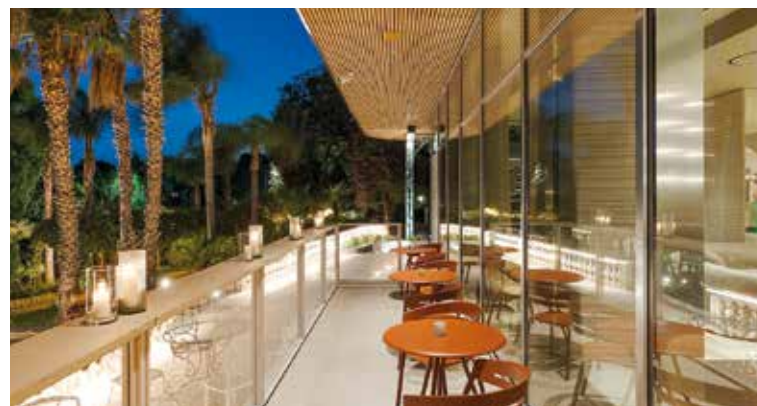
Entspannte Atmosphäre mit Blick auf den Palmengarten