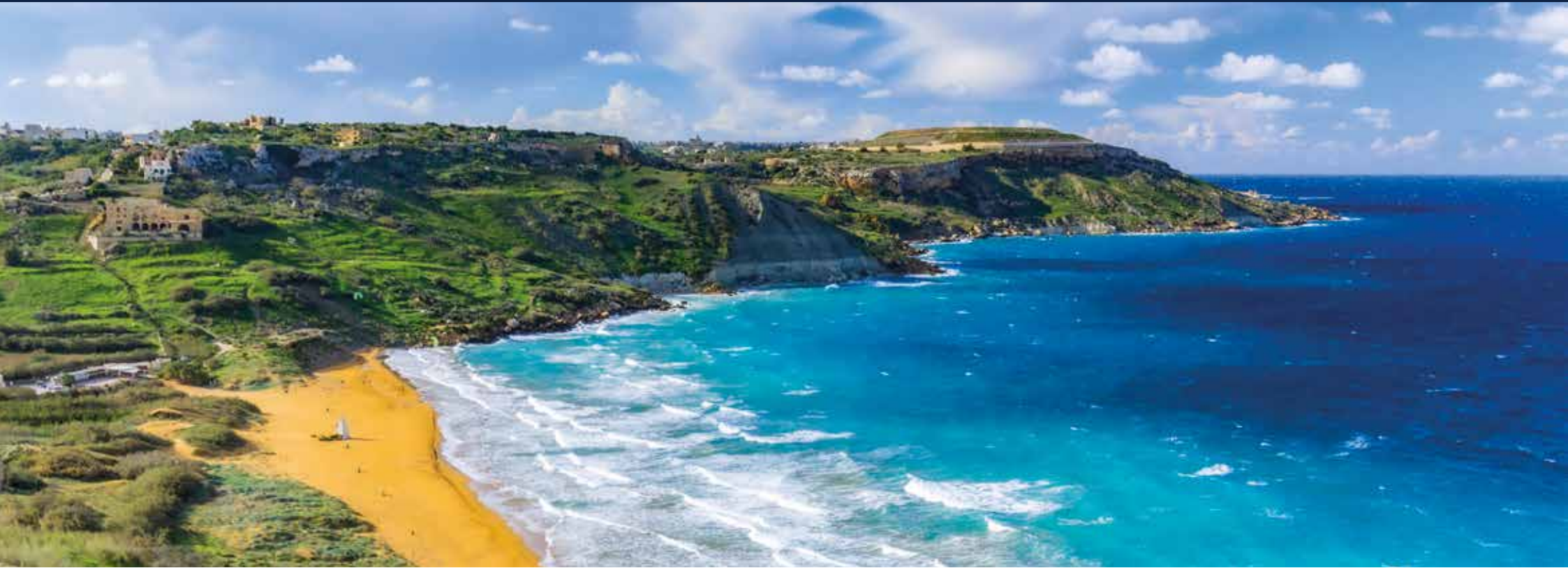
Ramla Bay auf Gozo – der größte Sandstrand der Insel ist berühmt für seinen rötlich-goldenen Sand und die umliegenden grünen Hügel