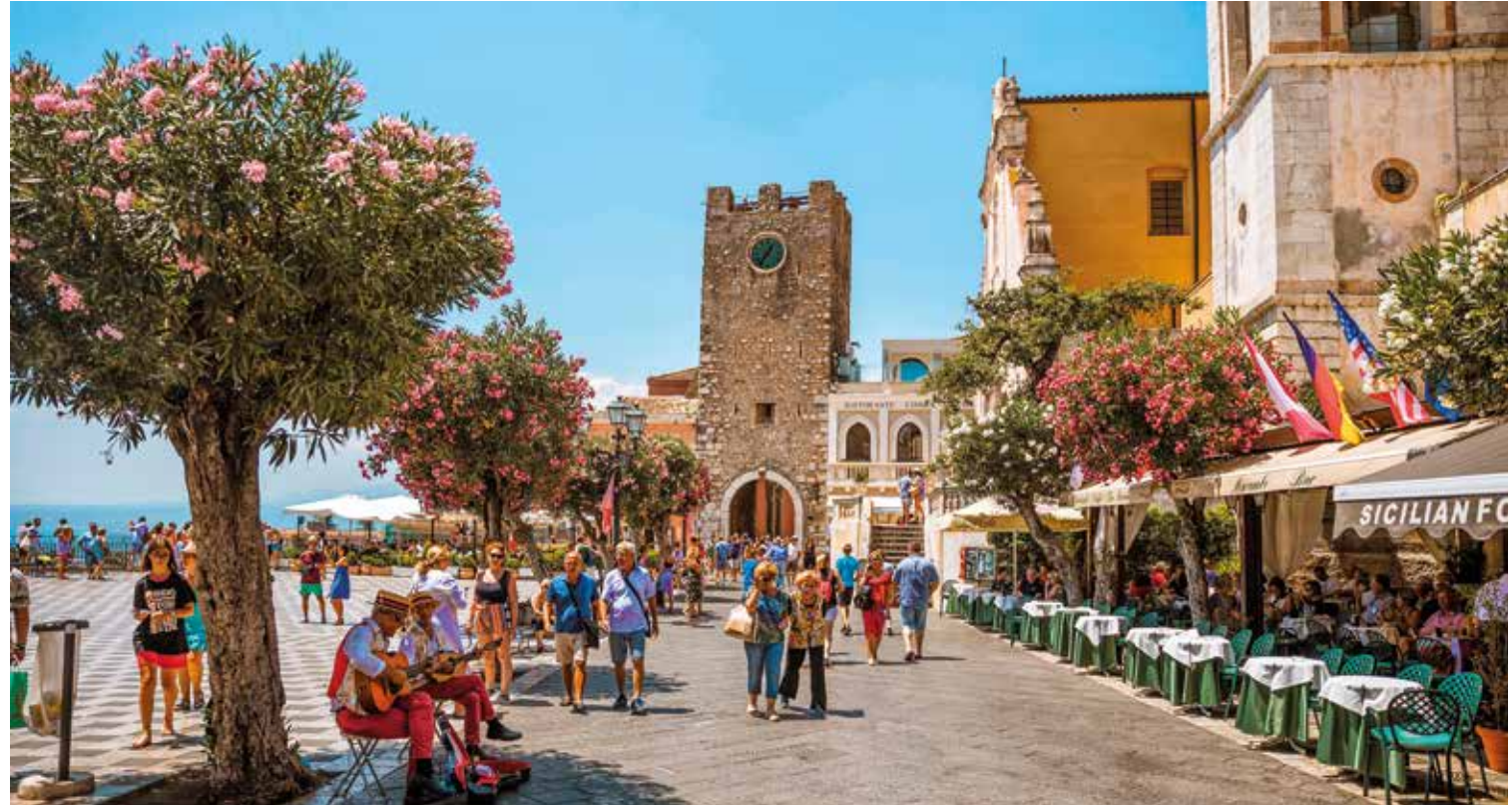
Belebter Platz im Herzen von Taormina mit historischen Fassaden und gemütlichen Straßencafés

Am Aussichtspunkt Bellavista genießen wir das weite Panorama vom Meer bis zum majestätischen Ätna. Anschließend erkunden wir Taormina bei einer Stadtführung. Bereits in der Antike gegründet, begeistert es bis heute mit eleganten Palazzi, malerischen Gassen und mediterranem Flair. Berühmt ist die Stadt auch für ihr antikes Theater, das zu den eindrucksvollsten Bauwerken Siziliens zählt. Zum Ausklang lädt die Altstadt mit ihren Cafés zum Verweilen ein.