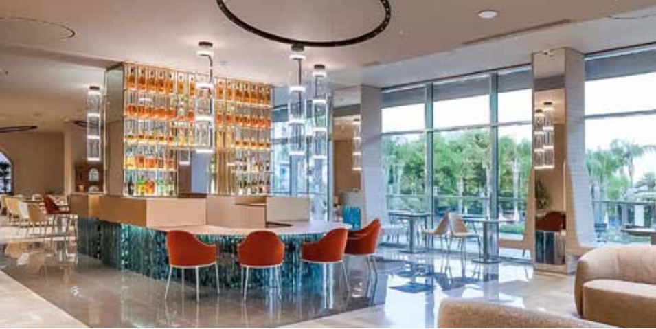
Stilvolle Lobbybar – abendlicher Treffpunkt in eleganter Atmosphäre