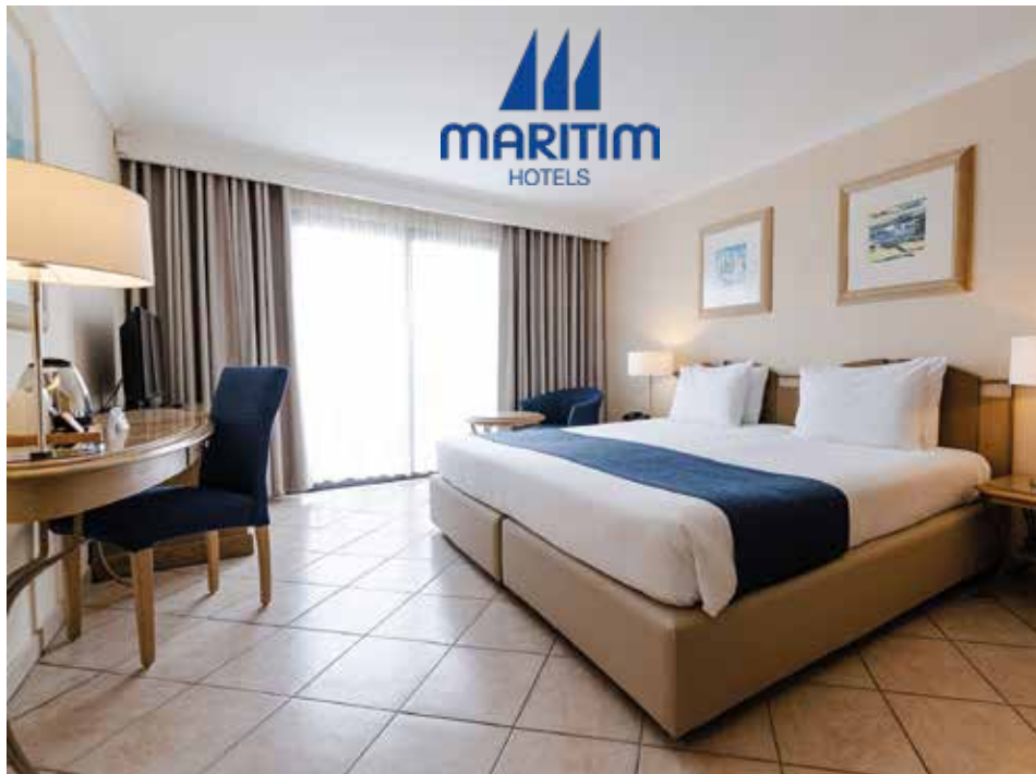
Einladendes Doppelzimmer – hell, stilvoll und zum Wohlfühlen