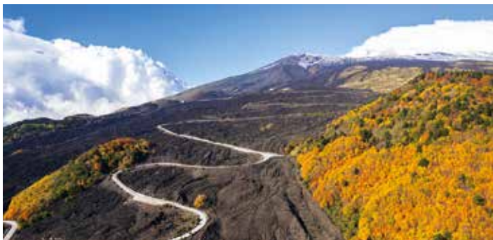
Kurvenreich ist unsere Fahrt auf den Ätna