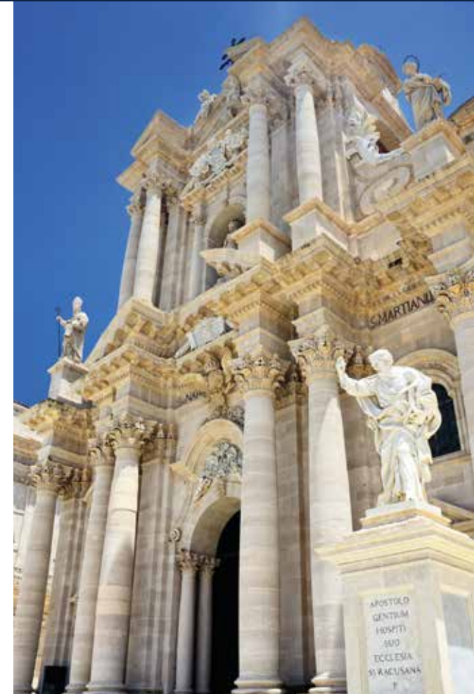
Kathedrale von Syrakus – prachtvoller Altarraum und majestätisch weiße Fassade