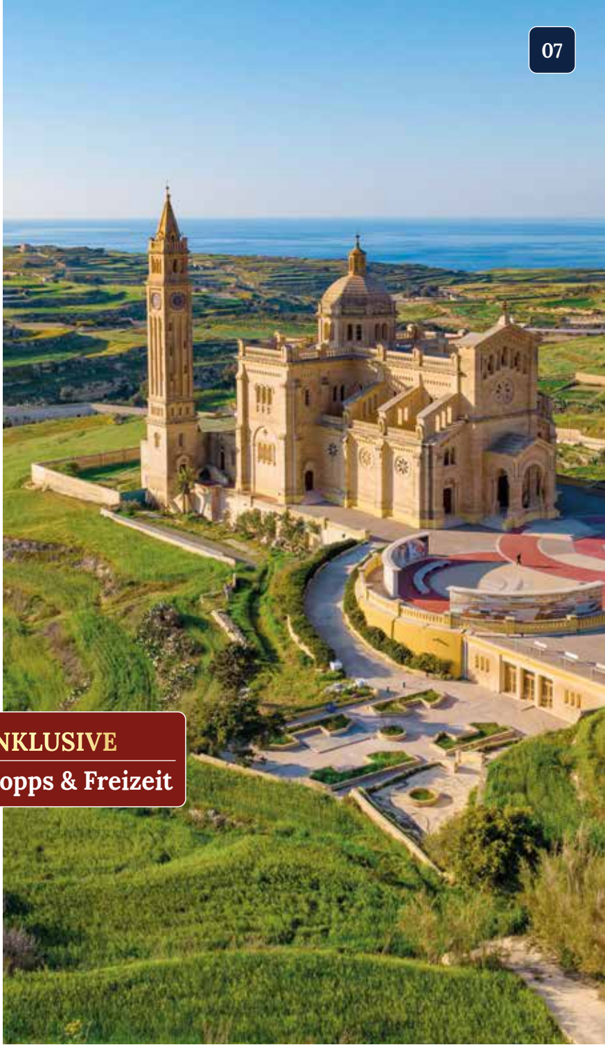
Eindrucksvolle Wallfahrtskirche Basilika Ta' Pinu