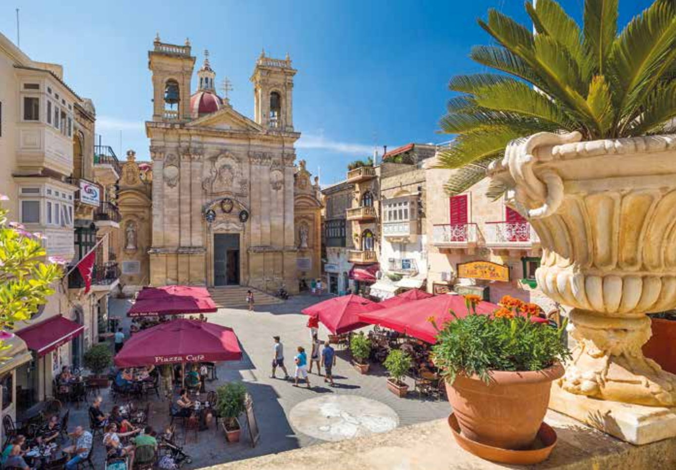
Hauptstadt Victoria – prächtige St.-Georgs-Basilika, umgeben von Cafés und Restaurants