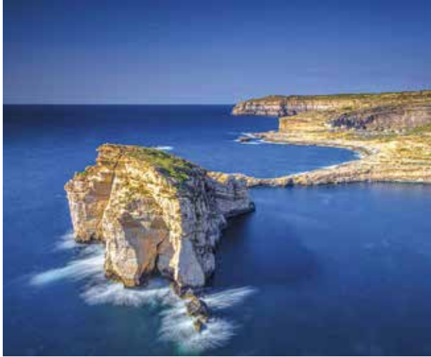
Markanter Felsen Fungus Rock in der Dwejra Bay