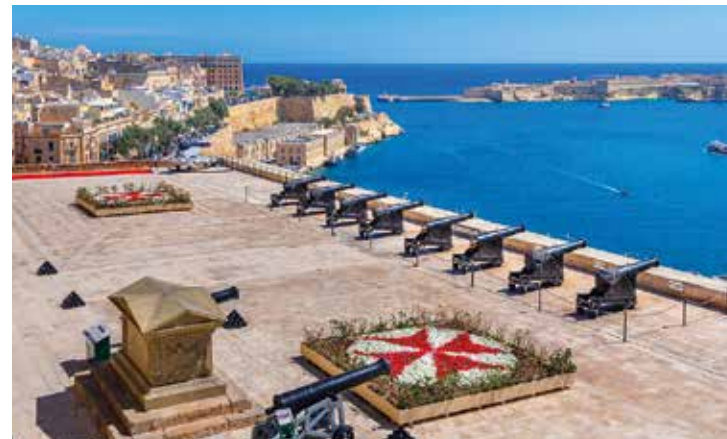
Ehemaliger Exerzierplatz mit Salut-Kanonen