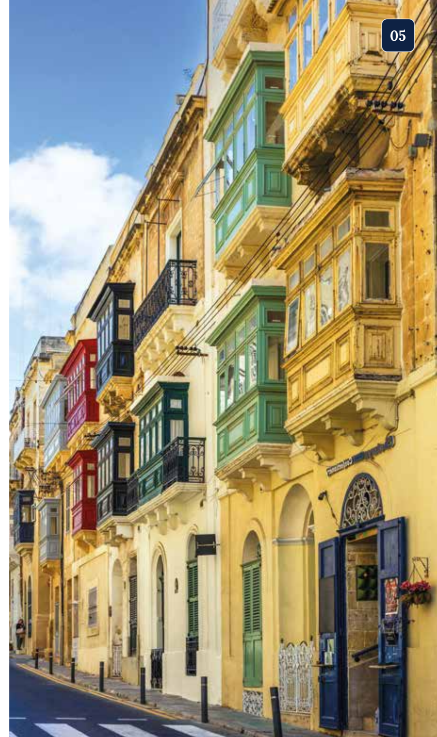
Bunte Holzbalkone prägen die Gassen von Valletta und Vittoriosa

Ein Höhepunkt jeder Malta-Reise ist die Schifffahrt durch den Grand Harbour. Vorbei an mächtigen Bastionen, barocken Palästen und alten Werften eröffnet sich ein Panorama, das die Macht des Johanniterordens bis heute widerspiegelt. Ziel ist Vittoriosa, wo sich die Ritter im Jahr 1530 niederließen und ihren ersten Sitz auf Malta errichteten. Während der Stadtführung entdecken wir historische Schauplätze dieser Ordensgeschichte und spüren in den verwinkelten Gassen den Charme vergangener Jahrhunderte. Im Anschluss lädt die breite Uferpromenade zum entspannten Schlendern und Verweilen ein.