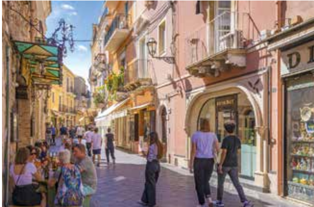
Freizeit für einen Altstadtbummel