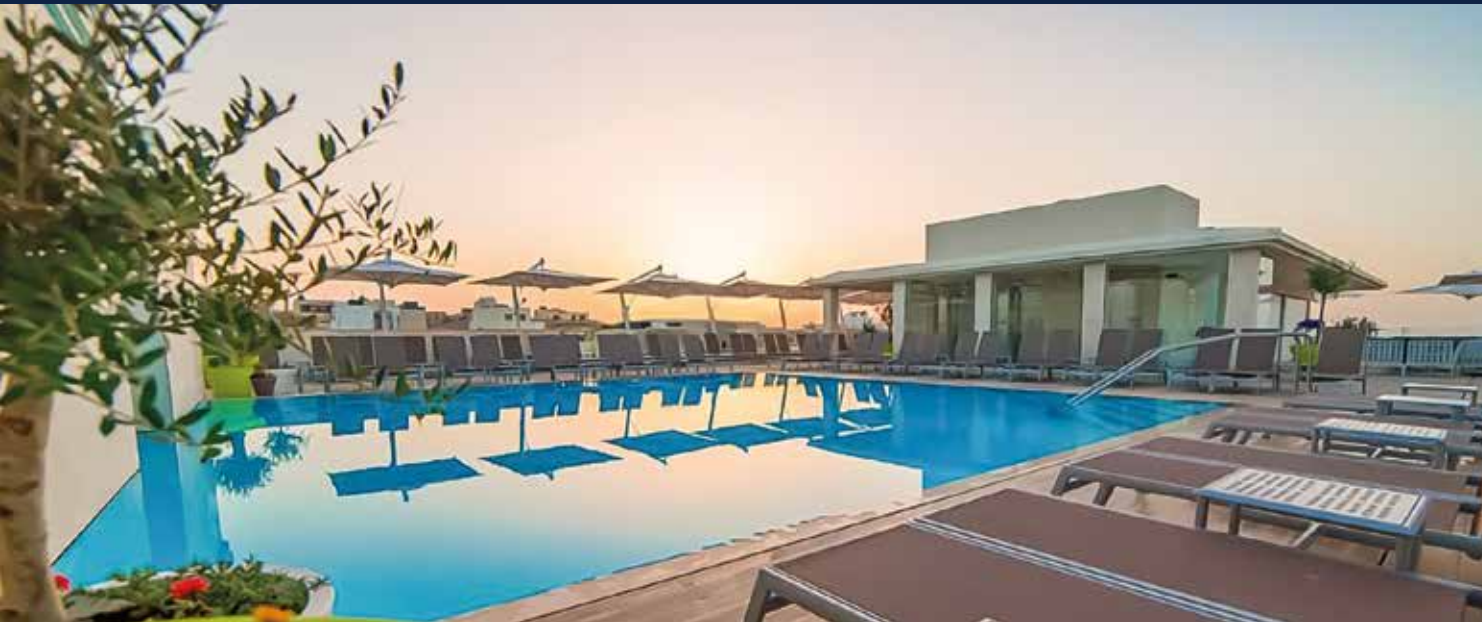
Entspannung am Rooftop-Pool – mit Sonnenuntergang über den Dächern der Stadt