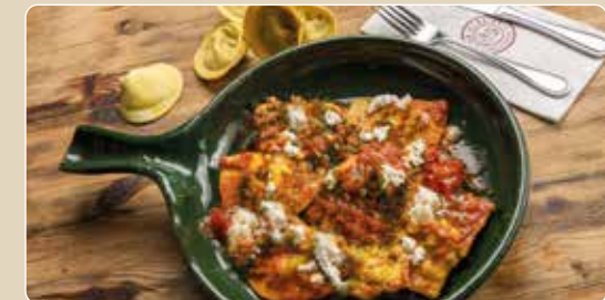
Ravioli Malti – traditionelles Inselgericht