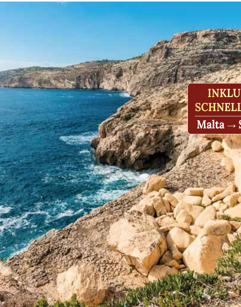
Dingli Cliffs: einer der schönsten Panoramapunkte Maltas

In Mosta besichtigen wir die monumentale Rotunde. Ihre Kuppel gehört zu den größten Europas. Bei der Stadtführung entdecken wir die kunstvolle Architektur und erfahren mehr über die Geschichte dieses eindrucksvollen Bauwerks. Weiter geht es nach Mdina, die frühere Hauptstadt der Insel. Wegen ihrer autofreien Straßen wird sie auch „die stille Stadt“ genannt, deren Adelshäuser und grandiose Paläste das zeitlose Ortsbild prägen.