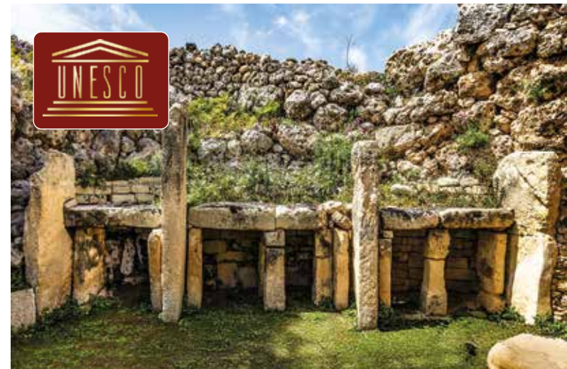
Ggantija, eine der ältesten frei stehenden Kultstätten der Welt

Mit dem Schiff gleiten wir hinaus auf das glitzernde Blau des Mittelmeers und genießen die weite Aussicht, bis die Silhouette von Gozo am Horizont erscheint. Auf der Insel beginnt unsere Rundfahrt mit dem Besuch des Ggantija-Tempels, eines der ältesten frei stehenden Bauwerke der Menschheit. Von der Calypso Cave eröffnet sich ein herrlicher Blick auf die rotgoldene Ramla Bay, bevor wir beim Spaziergang durch Victoria die charmante Inselhauptstadt kennenlernen. Ein Fotostopp an der berühmten Wallfahrtskirche Ta' Pinu, die für ihre Wunderberichte und Heilungslegenden verehrt wird, sowie Freizeit im malerischen Küstenort Xlendi runden diesen abwechslungsreichen Ausflug ab.