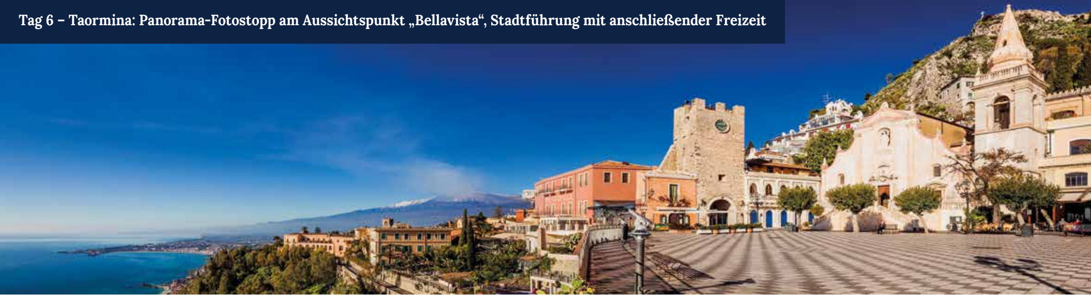
Hoch über dem Meer thront Taormina und schenkt uns einen einzigartigen Ausblick auf die Küste und den Vulkan Ätna