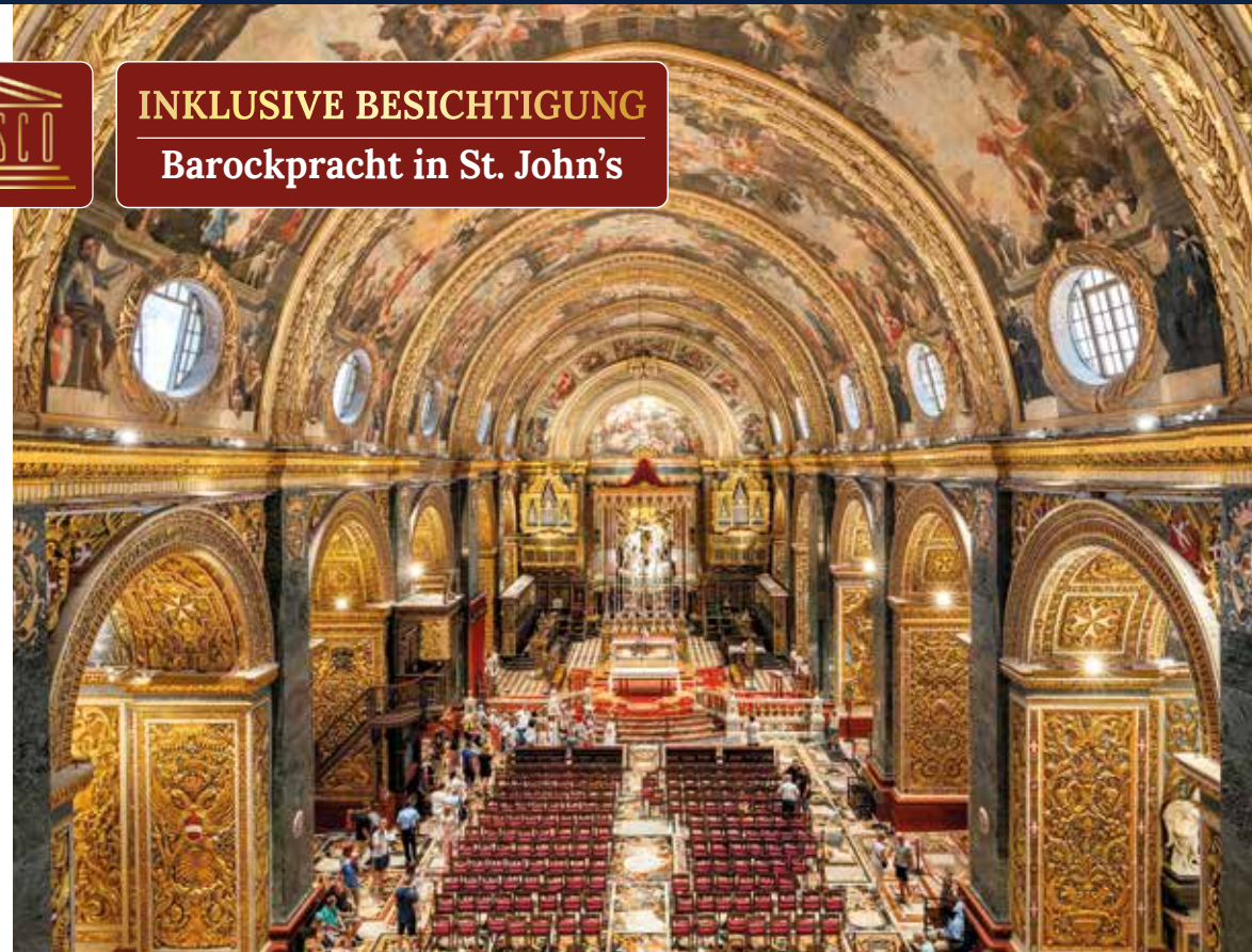
Die St. John's Co-Kathedrale in Valletta – schlicht von außen, im Inneren ein barockes Prunkstück mit reich verzierten Bögen und prachtvollem Altarraum

INKLUSIVE BESICHTIGUNG Barockpracht in St. John's