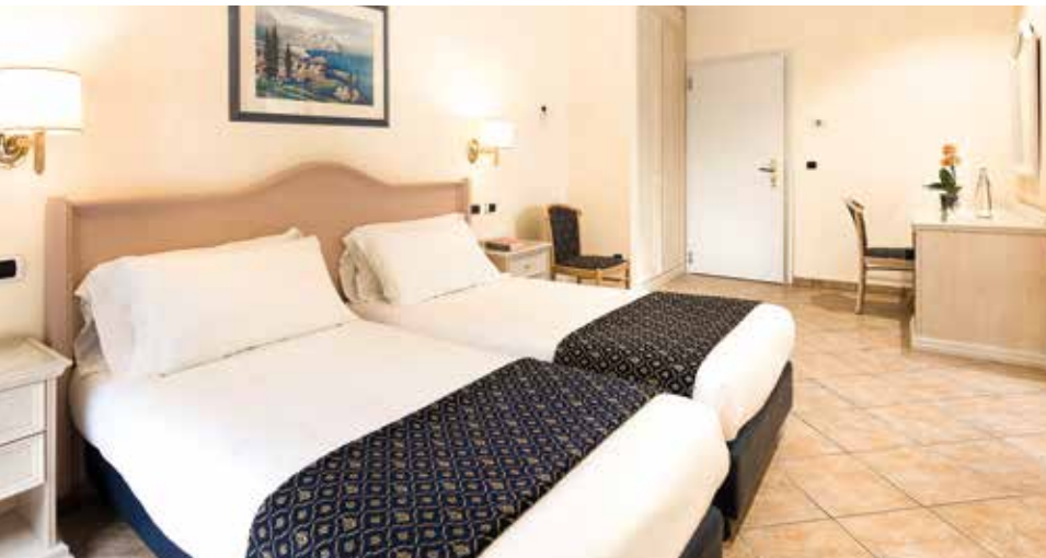
Zeitlose Eleganz kombiniert mit Wohlfühl-Komfort