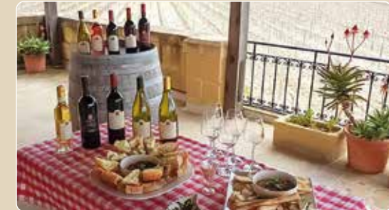
Weinprobe mit Crackern, Käse, Oliven