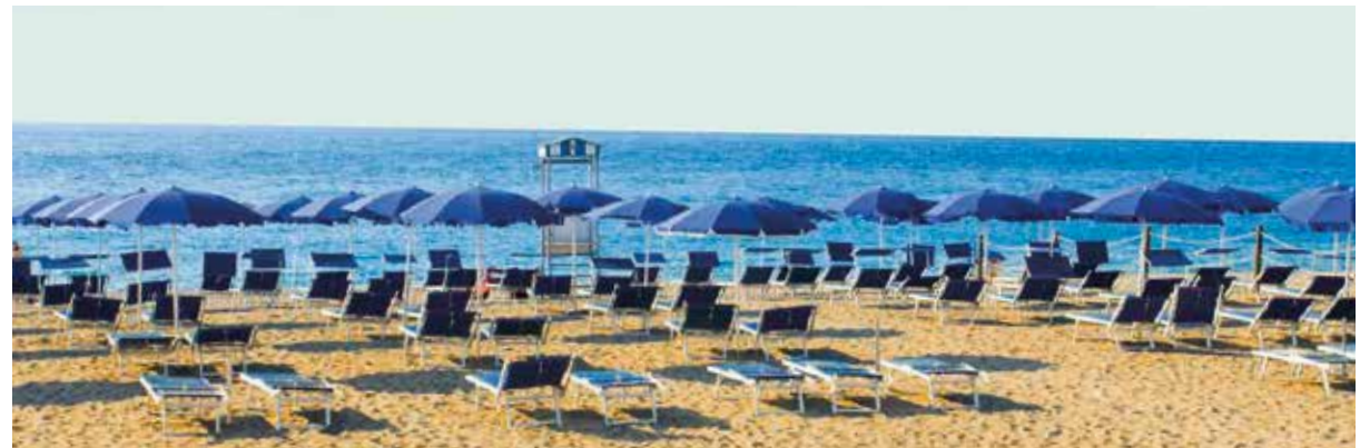
Am hoteleigenen Strand die Sonne genießen