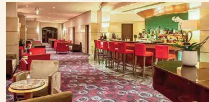
Die Hotelbar ist der ideale Treffpunkt am Abend

Booking.com: „Fabelhaft“, Stand: November 2025