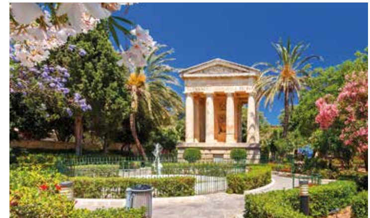
Freizeittipp: Vallettas Oase, die Lower Barrakka Gardens