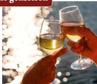
Den Augenblick genießen

Am Strand von Giardini-Naxos heißt es ein letztes Mal: die Seele baumeln lassen. Wer möchte, bummelt entlang der Promenade mit Cafés und kleinen Geschäften, die typische Souvenirs wie handbemalte Keramik oder Schmuck aus Lavastein anbieten. Dieser Tag gehört ganz der Erholung – ein Cappuccino mit Meerblick, barfuß durch den warmen Sand spazieren – ein letztes Stück Dolce Vita, bevor wir am nächsten Tag Abschied nehmen.