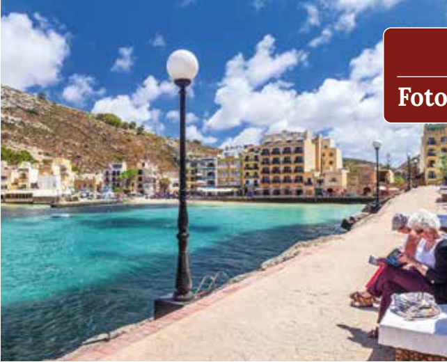
Promenade an der Xlendi Bay