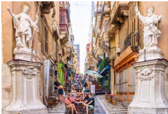
Schmucke Altstadtgasse in Valletta