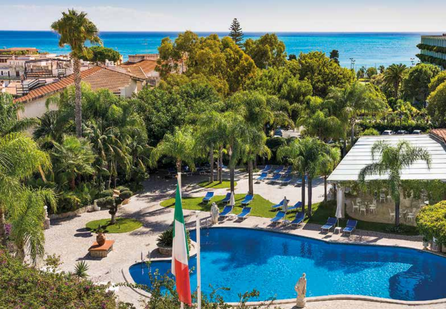
Urlaubsfeeling pur: Pool, Palmen und das Meer ganz nah