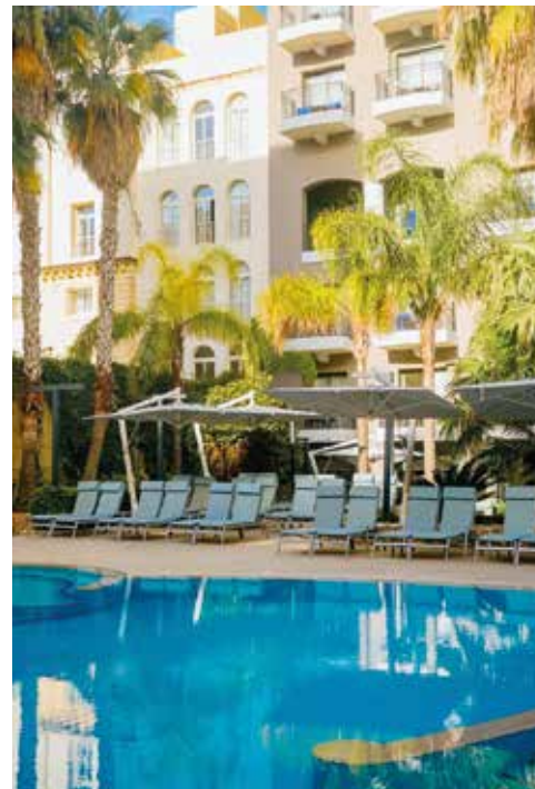
Pool, umgeben von Palmen