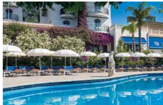
Gönnen Sie sich eine Auszeit am Pool