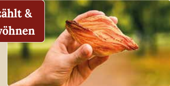
Pastizzi – maltesisches Streetfood