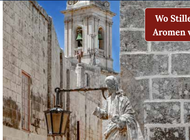
Mdina – barocke Zeitzeugen in stiller Kulisse