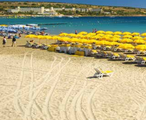
Freizeittipp: Strand von Mellieha Bay