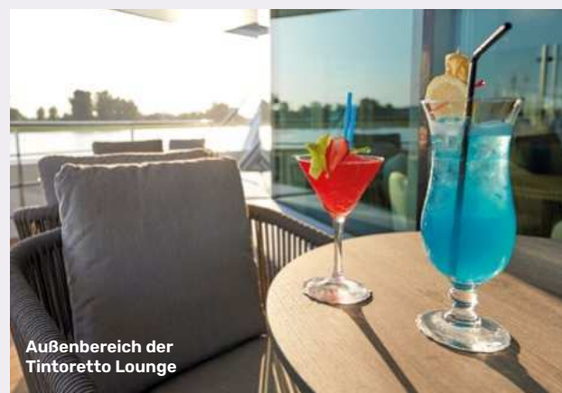
Außenbereich der Tintoretto Lounge