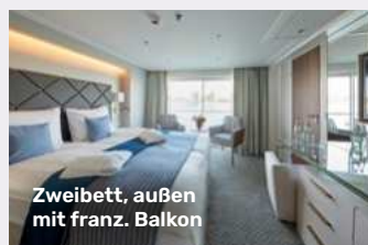
Zweibett, außen mit franz. Balkon

Ihre Zahlungen sind gemäß der gesetzlichen Bestimmungen über DRSF, Deutscher Reisesicherungs fonds GmbH, Sächsische Straße 1, 10707 Berlin, versichert.